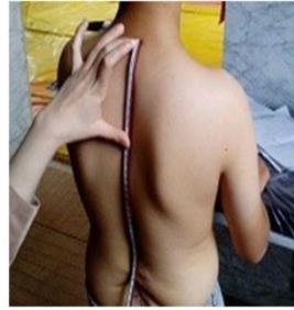
شکل ۲. نحوه اندازه‌گیری و محاسبه زاویه قوس پشتی بوسیله خط کش منعطف

برای اندازه‌گیری زاویه کرانیوورترال (CV) از گونیامتر مخصوص HPSCL ساخت ایران استفاده شد. جهت ارزیابی، زائده خاری CV تعیین و علامت‌گذاری شد. سپس در حالی که کودک در یک وضعیت طبیعی روبه رو را نگاه می‌کرد، در نمای جانبی، محقق، محور گونیامتر را موازی با زائده خاری مهره CV و بازوی متحرک آن را روی تراگوس گوش (غضروف بخش قدامی) تنظیم کرد. زاویه میان بازوی متحرک و خط افقی که از مهره CV عبور می‌کند، زاویه کرانیوورترال است (۲۱). میانگین سه مرتبه اندازه‌گیری، برای تحلیل نهایی به کار رفت. دامنه حرکتی اکستنشن و فلکشن زانو و ران و ابداکشن ران با گونیامتر یونیورسال ۳۶۰ درجه اندازه‌گیری شد که در تحقیقات گذشته رویایی بالا و پایایی خوب تا عالی برای آن گزارش کردند (۲۴، ۲۵) و با استناد به توصیه‌های آکادمی جراحان ارتوپدی آمریکا (۱۱)، در هریک از شرکت‌کنندگان در سه آزمایش، اندازه‌گیری شد و میانگین آنها برای تحلیل نهایی به کار رفت. لازم به ذکر است با قرار دادن دست روی ران و لگن طرف مقابل مانع از هرگونه حرکت جبرانی و ایجاد خطا در اندازه‌گیری گشت.