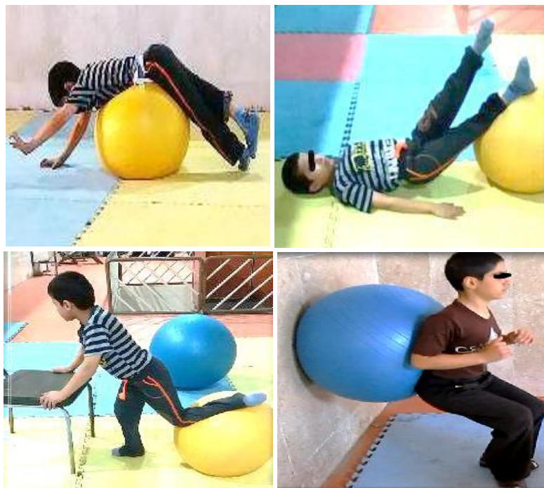
شکل ۳. نمونه‌هایی از تمرینات انجام شده

در تحقیق حاضر برای طبقه‌بندی و خلاصه‌سازی اطلاعات از آمار توصیفی، میانگین و انحراف معیار و برای تحلیل داده‌ها از آزمون t وابسته در سطح معناداری ( P \leq 0/05 ) در نرم افزار آماری SPSS نسخه ۲۲ استفاده شد.