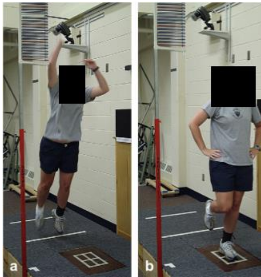
شکل ۱. نحوه انجام پروتکل پرش-فرود روی دستگاه توزیع فشار کف پا

می‌کرد. آزمودنی‌ها چندین مرتبه آزمون را به منظور آشنایی انجام می‌دادند و در آخر، سه مرتبه، آزمون تکرار و داده‌ها ثبت می‌شد (۱۶) (شکل ۱).