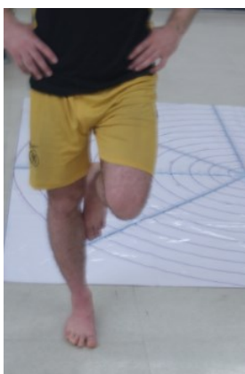
شکل. آزمون تعادل ایستا (استورک)

جهت ارزیابی تعادل ایستا از آزمون استورک استفاده شد (۲۱). بدین ترتیب که ورزشکار بر روی پای غیربرتر خود - ایستاده و کف پای برتر خود را به نحوی در کنار داخلی زانوی پای غیربرتر خود قرار می‌داد که انگشتان به سمت پایین قرار بگیرند. دستان در کنار کمر و بر روی تاج خاصه قرار می‌گرفت و با فرمان آزمونگر، از فرد خواسته شد تا چشمان خود را بسته و پاشنه پای غیربرتر را از زمین بلند کند و بر روی سینه پا بایستد. همزمان با بلند شدن پاشنه فرد، مدت زمان مربوط به انجام تست ثبت شد. در صورتیکه تعادل وی به هر دلیلی به هم می‌خورد و یا مرتکب خطا می‌شود، زمان قطع و رکورد وی ثبت شد؛ لازم به ذکر است که در آزمون استورک، زمان بالاتر بیانگر تعادل ایستای بهتر آزمودنی است. هر آزمودنی این تست را ۳ مرتبه اجرا و میانگین ۳ اجرای صحیح وی به عنوان رکورد نهایی در نظر گرفته شد. روسیتر ۱ پایایی خوبی (۰/۶۶) برای این آزمون گزارش کرده است (۲۲).