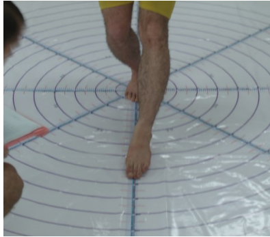
شکل ۳. آزمون تعادل پویا (۲)

تبادل ایستا، هر آزمودنی این تست را سه مرتبه اجرا و میانگین سه اجرای وی به عنوان رکورد نهایی وی در نظر گرفته شد. شافر ۱ پایایی بسیار بالایی (۰/۹۳ - ۰/۸۵) را برای این آزمون گزارش کرده است (۲۳).