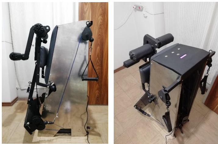
شکل ۲. نمونه اولیه ساخته شده دستگاه (پس از اعمال تغییراتی نسبت به نمونه سه بعدی طراحی شده)

بخش الکترونیکی دستگاه از یک مدار (کدنویسی شده به زبان ++C)، نمایشگر دیجیتال و استپر موتور ساخته شد که در واقع کل این مجموعه، وظیفه محاسبه مقاومت خروجی که توسط کاربر تعیین می شود را دارد. به این صورت که پس از اعمال مقاومت موردنظر به سیستم، استپر موتور دستگاه که درون بخش ثابت مکانیزم نصب شده و موجب به چرخش درآوردن رزوه ۱۲ میلیمتری در مرکز می شود، وضعیت مکانیزم را (با دقت ۰,۵ گیلوگرم) تنظیم می کند. نمایشگر دیجیتال نیز بر روی دستگاه نصب شده و کاربر به راحتی توسط ۳ کلید (افزایش-کاهش-تایید) می تواند به مدار دستور اعمال کند (شکل ۲).