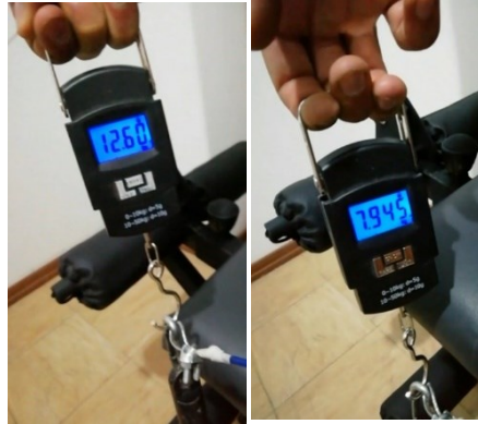
شکل ۵. اندازه گیری مقاومت دستگاه توسط نیروسنج دیجیتال برای سنجش روایی در مقاومت های ۸ و ۱۲٫۵ کیلوگرم