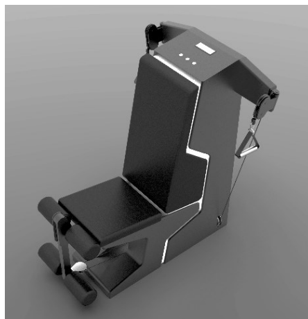
شکل ۱. مدل سه بعدی دستگاه توسط نرم‌افزار راینو

در ابتدا ایده اصلی این دستگاه که همان مکانیزم مکانیکی تغییر گشتاور خروجی بود، پس از انجام محاسبات اولیه بر روی کاغذ، در نرم‌افزار راینو به صورت شماتیک ترسیم شد. سپس با توجه به دامنه تغییرات گشتاور و محاسبه ابعاد و اندازه دقیق اجزای مکانیزم، این قطعات توسط نرم‌افزار اتوکد ترسیم شده و با استفاده از این نقشه‌های دوبعدی و انتقال به نرم‌افزار راینو حجم سه‌بعدی نهایی با دقت مدل‌سازی شد. پس از طراحی مکانیزم، ابعاد اسکلت، بدنه و فرم دستگاه و نشیمنگاه آن با توجه به ابعاد و ارگونومی بدن انسان [۱۴] در نرم‌افزار راینو طراحی و مدل‌سازی شد (شکل ۱).