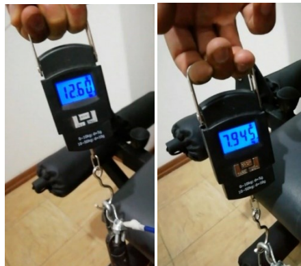
شکل ۵. اندازه گیری مقاومت دستگاه توسط نیرو سنج دیجیتال برای سنجش روایی در مقاومت های ۸ و ۱۲٫۵ کیلوگرم