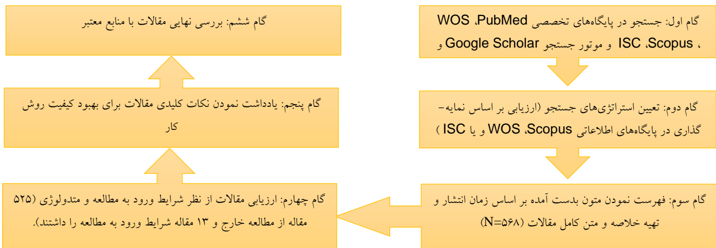
دیاگرام 1. نحوه بررسی کیفیت مقالات

تحلیل حذف شد. برای مشخص کردن عدم تجانس از آزمون I^2 استفاده شد که مقدار ناهمگونی بر اساس دستورالعمل کوکران به شرح زیر > 25\% = کم، > 50\% = متوسط و > 75\% = ناهمگونی زیاد تفسیر شد. در صورت وجود ناهمگونی، در ادامه تحلیل حساسیت از طریق روش خارج کردن یک به یک مطالعات با لحاظ کردن I^2 کمتر از 50 به عنوان ملاک انجام شد (13). سوگیری انتشار نیز با استفاده از تفسیر بصری از فونل پلات بررسی شد که در صورت وجود سوگیری، تست ایگر به عنوان به مشخص کننده ثانویه استفاده شد که در آن P < 0.1 به عنوان وجود سوگیری انتشار قلمداد شد. همچنین همبستگی سن و شاخص توده بدن آزمودنی‌ها با اندازه اثر تفاوت‌های میانگین استاندارد شده با استفاده از رگرسیون مدل لحظه‌ای بررسی شد (13). تمام آزمون‌های آماری با استفاده از نرم افزار CMA انجام شدند.