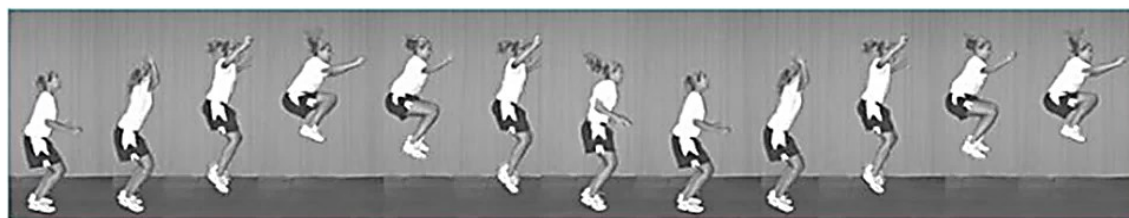
شکل ۱. تست پرش تاک (۳۳)

در این پژوهش قد آزمودنی‌ها با قدسنج و وزن آن‌ها از ترازوی دیجیتال استفاده شد. جهت ارزیابی نقص تنه از تست پرش تاک با پایایی بین آزمونگر (۹۳/۱) و پایایی درون آزمونگر (۸۷/۱) استفاده شد. در این آزمون فرد با پاهای باز به اندازه عرض شانه می‌ایستد و به صورت عمودی شروع به پرش می‌کند و زانوهای خود را تا حد امکان بالا می‌آورد. در بالاترین نقطه پرش، ران‌ها موازی با زمین قرار می‌گیرند. بلافاصله بعد از فرود، فرد باید پرش تاک بعدی را شروع کند. آزمودنی پرش تاک را به مدت ۱۰ ثانیه به صورت متوالی تکرار می‌کند. برای بهبود دقت ارزیابی از دو دوربین فیلمبرداری در دو نمای قدامی و جانبی استفاده شد، دوربین‌ها با فاصله سه متری از آزمودنی‌ها تنظیم شدند تا تصویر به صورت درشت‌نمایی شده برای بررسی در اختیار پژوهشگر قرار بگیرد، پس از انجام آزمون، برای بررسی سکانس‌های پرش، از نرم افزار کینوا استفاده شد فردی که قادر نباشد در محل شروع پرش خود فرود بیاید، در نقطه اوج پرش ران‌های موازی با زمین قرار نگیرد و پرش هایش در طول ۱۰ ثانیه با وقفه انجام گیرد، به عنوان فرد دارای نقص تنه در نظر گرفته شد (۱۸). هر آزمودنی سه بار با آزمون پرش ارزیابی شد و میانگین امتیازات ورزشکاران ثبت شد تا افراد مبتلا به نقص عصبی - عضلانی و به خصوص نقص تنه شناسایی شوند (شکل ۱) (۱۸).