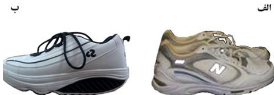
شکل ۱- الف: کفش کنترل؛ ب: کفش ناپایدار

کفش‌های تحت بررسی در این پژوهش در اندازه‌های ۴۲ تا ۴۴ برحسب اندازه پای آزمودنی‌ها تهیه شدند که شامل کفش کنترل (New Balance) و کفش ناپایدار (Perfect Steps- TM-030709 VP) بود (شکل ۱). این کفش‌ها به منظور مقایسه تأثیر شکل هندسه زیره کفش بر متغیرهای مرتبط با نیروی عکس‌العمل زمین انتخاب شدند. کفش ناپایدار انحنایی در راستای قدامی - خلفی دارد؛ درحالی که کفش کنترل دارای زیره معمولی بود.