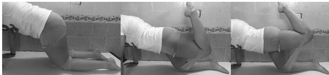
شکل ۳ نحوه انجام تمرین آزمودنی های گروه تجربی (از چپ به راست: ابتدا، میانه و انتهای حرکت باز کردن ران با مقاومت کش تمرین)

بیش از حد ران در برابر مقاومت کش تمرین) و برای ویژه تر کردن تمرین به صورت برونگرا، ۳ ثانیه انقباض برونگرا (حرکت خم کردن ران (بازگشت به وضعیت شروع حرکت)) طبق تصویر شماره ۳ انتخاب شد. اگرچه آزمون بر روی پای برتر افراد صورت می گرفت، به دلایل اخلاقی و به جهت برهم نزدن تعادل عضلانی بدن در دو سمت، تمرینات تقویتی به صورت متقارن برای هر دو پا انجام گرفت.