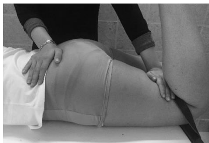
شکل ۱. نحوه اندازه‌گیری بیشینه قدرت ایزومتریک عضله سرینی بزرگ

انجام آزمون از بندهای محکم غیرقابل ارتجاع که از یک سمت به انتهای اندام موردنظر و از طرف دیگر به پایه تخت بسته می‌شد استفاده شد. این امر باعث اعتباربخشی بیشتر به آزمون‌های سنجش قدرت ایزومتریک با دینامومتر دستی می‌گردد (۲۶). از آزمودنی خواسته می‌شد که ۵ شماره با نهایت قدرت به دینامومتر دستی دیجیتال مدل JTECH Medical MN084_A Commander که در انتهای اندام و زیر بند ثابت‌کننده قرار داشت فشار وارد کند. مجموعاً سه بار اندازه‌گیری قدرت با انجام باز کردن بیش از حد ران به مقدار ۲۰ درجه، انقباضات ۵ ثانیه‌ای و استراحت ۳۰ ثانیه‌ای بین تکرارها انجام شد. میانگین سه عدد به دست آمده به عنوان ماکزیمم قدرت ایزومتریک عضله برحسب نیوتن ثبت گردید (۲۷). عدد به دست آمده بر وزن فرد برحسب نیوتن تقسیم شده و ضربدر عدد ۱۰۰ شد و ماکزیمم قدرت عضله برحسب درصد وزن بدن گزارش گردید.