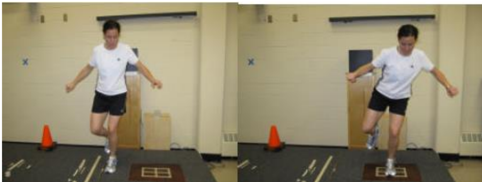
شکل ۲. نحوه انجام پروتکل جهش جانبی روی دستگاه توزیع فشار کف‌پایی