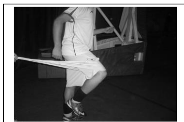
دست و پای مخالف (راه رفتن)