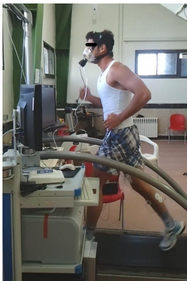
شکل ۱. پروتکل دویدن با استفاده از نوارگردان و دستگاه گاز آنالایزر متامکس در آزمایشگاه شبیه‌سازی شده به دویدن در یک مسابقه دو ۵۰۰۰ متر استقامت

هنگام اجرای آزمون، همچنان‌که سرعت دویدن افزایش می‌یافت، اکسیژن مصرفی نیز قبل از رسیدن به حالت پایدار افزایش پیدا کرد. برای بررسی تغییرات اکسیژن مصرفی در مجموع پروتکل به این صورت عمل شد که اکسیژن مصرفی دو دقیقه انتهایی تمام آزمودنی‌ها برای هر سه سرعت ۴، ۶ و ۸ کیلومتر بر ساعت انتخاب شد. در نتیجه برای هر وزن یک ستون از داده‌های اکسیژن مصرفی به دست آمد. با مقایسه اکسیژن مصرفی کل دوره آزمون در هر وزن، به مشاهده اثر تغییرات وزن کفش بر میزان تغییرات اکسیژن مصرفی و در نتیجه اقتصاد دویدن پرداخته شد. اقتصاد دویدن از طریق محاسبه میانگین اکسیژن مصرفی دو دقیقه انتهایی هر مرحله، در صورتی‌که به حالت پایدار می‌رسید، تخمین زده شد. میانگین اکسیژن مصرفی به دست آمده، هزینه اکسیژنی را که برای رسیدن به آن سرعت نیاز است نشان می‌دهد که می‌تواند بین دوندها مقایسه شود. مصرف اکسیژن کمتر برای رسیدن به یک سرعت مشخص نشان‌دهنده دویدن اقتصادی‌تر است. برای محاسبه OUES از روش بابا و همکاران (۱۹۹۶) استفاده شد (۱۶) که در آن اکسیژن مصرفی (میلی لیتر بر دقیقه) روی محور عمودی و تهویه کل (میلی لیتر بر دقیقه بر کیلوگرم) در تابع لگاریتم روی محور افقی قرار می‌گیرد. شیب خط معادله یک مجهولی ارتباط دو محور افقی و عمودی به عنوان OUES در نظر گرفته می‌شود (معادله ۱) (۱۴، ۱۵).