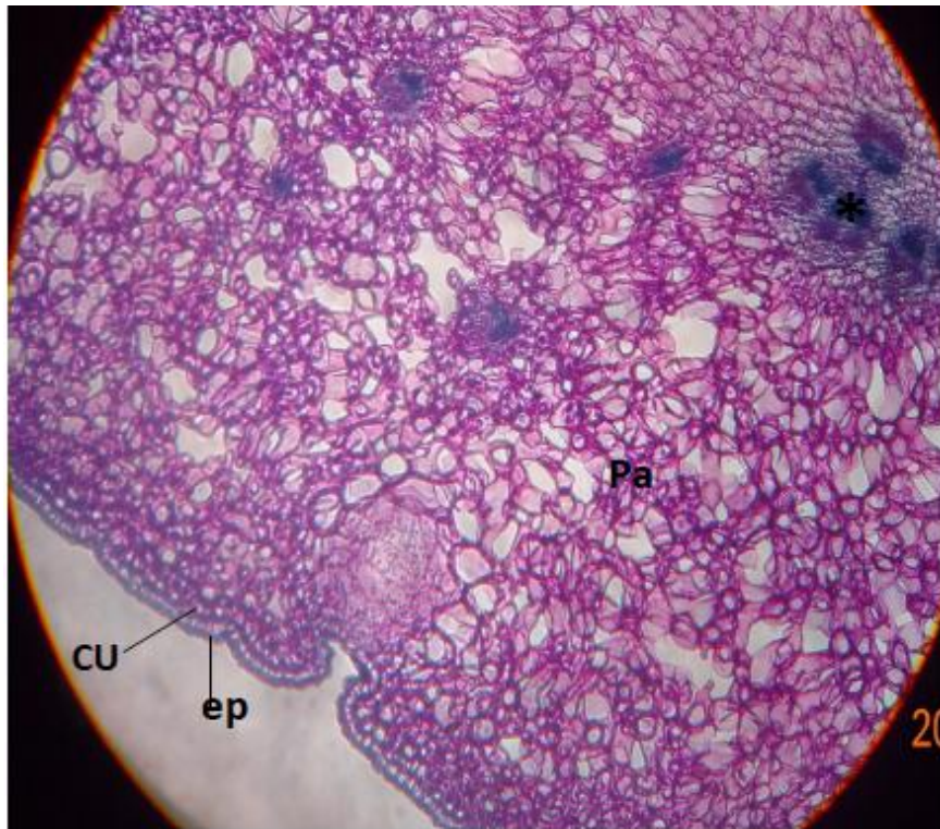
شکل ۲. اپیدرم (Ep)، کوتیکول (Cu)، پارانثیم (Pa) * دستجات اوئدی

در مرحله تجزیه سلولی، ابتدا به‌علت از هم پاشیدن و از بین رفتن سلول مرکزی، حفره کوچکی تشکیل می‌شود که در نهایت به حفره‌ای بزرگ تبدیل می‌شود. سلول‌هایی که اطراف حفره قرار دارند، در مقایسه با سلول‌های کشیده بیرونی دارای دیواره نازک و سیتوپلاسم غلیظتری هستند که به‌صورت غلاف، سلول‌های ترش‌هی را در بر می‌گیرد. ضخامت دیواره‌ها احتمالاً به‌منظور استحکام بخشیدن به کیسه ترش‌هی است (شکل ۳). کیسه‌های ترش‌هی در گلبرگ دارابی در نزدیکی اپیدرم فوقانی قرار دارند. به‌تدریج به‌سمت گلبرگ در گل بالغ، حجم و تعداد لایه‌های کیسه‌های ترش‌هی افزایش می‌یابد و سلول‌های ترش‌هی کننده اسانس، سیتوپلاسم خود را از دست می‌دهند.