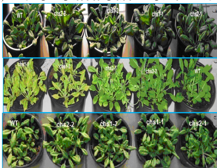
شکل ۱. گیاهان تحت تیمارهای دمایی متفاوت. الف) گیاهان شاهد، ب) گیاهان تحت تیمار سرما، ج) گیاهان تحت تنش سرما

ویژگی‌های مورفولوژیکی ناشی از دمای پایین در گیاهان جهش یافته آرابیدوپسیس تحت تیمار سرما مشاهده شد. تحت این تیمار دمایی برگ گیاهان جهش یافته زرد شد و پس از یک هفته قرارگیری در معرض تیمار سرما همه این گیاهان از بین رفتند و با بازگشت به دمای رشد نرمال زنده نماندند (شکل ۱ ب). تحت تنش سرما و شاهد گیاهان وحشی و جهش یافته ظاهر طبیعی داشتند و ویژگی مورفولوژیکی خاصی نشان ندادند (شکل ۱ الف ج).