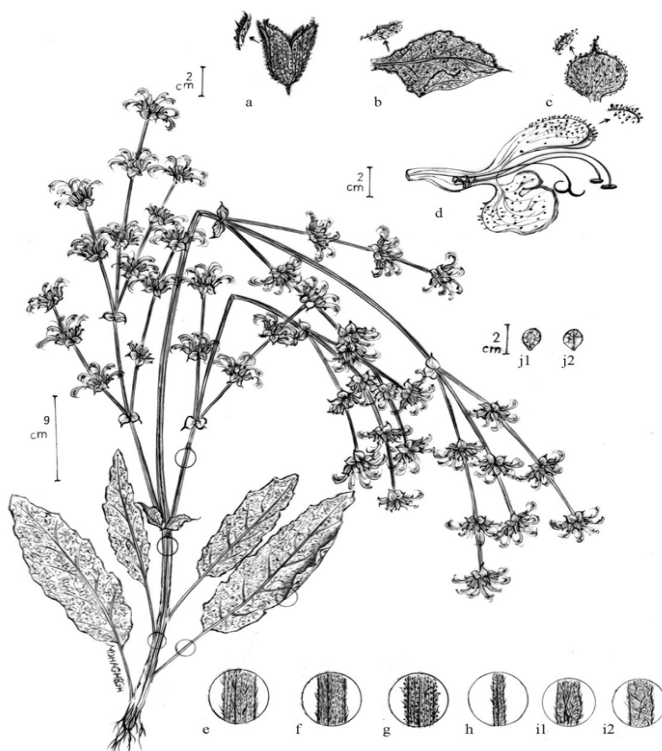
شکل ۱. شکل رویشی سالویا آتروپاتانا (۸۴): (a) کاسه گل، (b) برگ گل آذینی، (c) براکته، (d) جام گل، (e) قاعده ساقه، (f) بخش فوقانی ساقه، (g) محور گل آذین، (h) دم برگ، (i1) سطح فوقانی برگ، (i2) سطح تحتانی برگ، (j1 ، j2) فندقه (مؤلف مقاله)

تعداد گل در هر چرخه از محور گل آذین ۶-۷ گل، دمگل ۲ تا ۳/۵ میلی متر و تنها شامل پوشش مودار و کم و بیش زیر است.