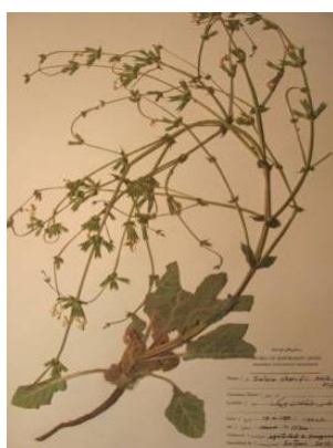
شکل ۳. تصویر گونه S. shariffi

کاسه گل و عرض کاسه گل (LEBR, WIBR, THBR, GLST, MDSL, WICA) از هم جدا می‌شوند. گونه سالویا ماکروسیفون از گونه سالویا اسپینوزا با صفاتی مانند رنگ و ضخامت براکته (سبز و علفی)، نوک دندانها و براکته به شدت خاردار، کرک براکته، بیرون زدگی خامه گل و کرک کاسه گل (WICA, TRCA, APBR, COBR, THBR, SCTE, TRBR, EXST) جدا می‌شود. در چند نمونه بررسی شده، پرشاخه بودن سالویا اسپینوزا نسبت به سالویا ماکروسیفون مشاهده شده است، اما نمی‌توان به یقین از آن به عنوان یک صفت جداکننده نام برد. گونه سالویا شریفی برای اولین بار برای خراسان گزارش می‌شود، گونه‌ای که بسیار شبیه به گونه سالویا ماکروسیفون است. در ابتدا این گونه به دلیل صفاتی مانند عرض کاسه گل، ضخامت و نوک براکته با گونه سالویا ماکروسیفون اشتباه گرفته شد. در فلورا ایرانیکا [۹]، صفت جداکننده این گونه، کوچکتر بودن براکته نسبت به کاسه گل بیان شده است. در این پژوهش مشخص شد که این صفت مناسب نیست و با کمک صفاتی چون نازک بودن شاخه‌های جانبی، شاخه‌های جانبی نازک، طول کاسه گل، براکته‌های کوچک و رأس آن‌ها (THBA, SIBR, LECA, LEBR, WIBR, APBR)، این دو گونه بهتر از یکدیگر قابل تفکیک هستند (جدول ۲) (شکل ۳).