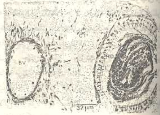
شکل ۷- عکس میکروسکوپی برشی از مجرای نر- ماده BV (Genital Artery = Blood Vessel) نریان تناسلی؛ CT (Connective Tissue) بافت پیوندی؛ HD (-hermaphrodite duct) مجرای نر-ماده؛ SP (Sperm) اسپرم.

مذکور به مجرای نر ماده و غده آلبرمین اتصال دارد و در ناحیه قدامی به مجرای برنده تخمک و اسپرم تقسیم می‌شود. این مجرا در سراسر طول خود چین‌خورده و بیچ خورده بوده و طویل‌ترین بخش دستگاه تولید مثل را بوجود می‌آورد. مجرای مشترک در حیوانات بالغ دارای ۵۰-۴۰ میلی‌متر طول و ۳-۴ میلی‌متر قطر می‌باشد. این مجرا از نظر تشریحی و بافتی تقریباً از دو مجرای مجزا تشکیل شده اما از نظر فیزیولوژیکی از دو کانال کاملاً مشخص نر ماده بوجود آمده است. دو غده ضمیمه تحت عنوان غده نر و غده پروستات با کانال نر و یک غده ماده به کانال ماده اتصال دارد. در حیوانات بالغ مجرای تناسلی ماده وسیع‌تر و چین‌خورده‌تر از مجرای نر می‌باشد.