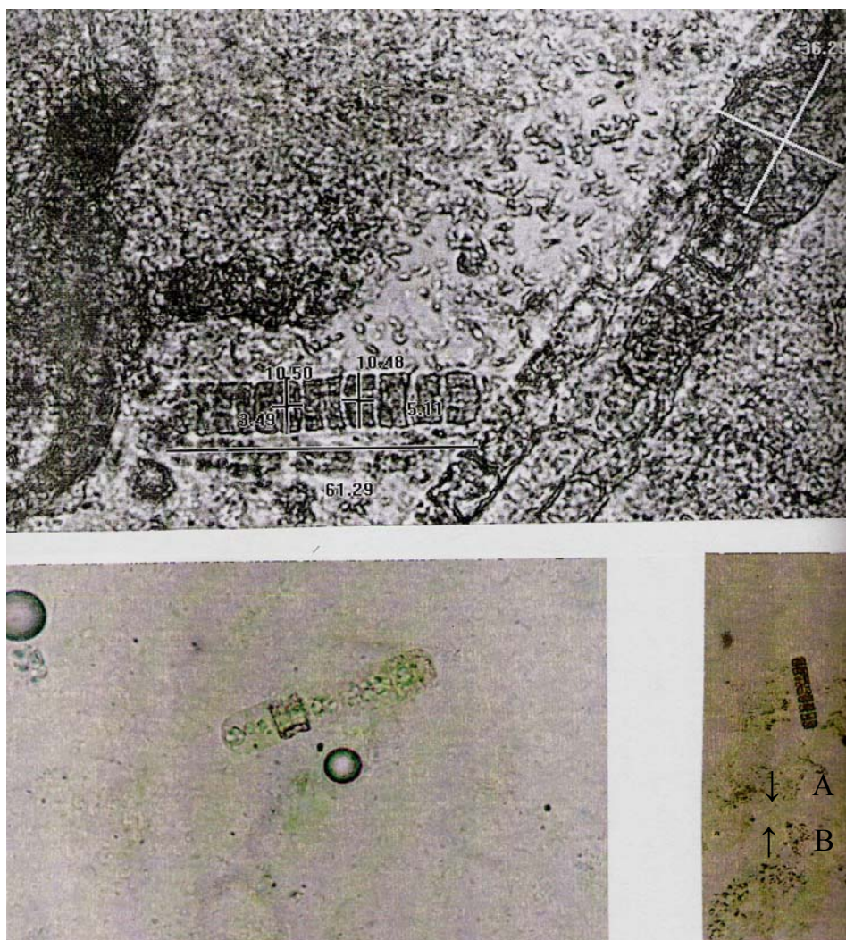
A- آنالیز تصویری اسیلاتوریا: در سمت چپ و پایین سلول‌های رویشی ترایکوم به ابعاد متوسط ۴/۳۰ ۱/۴۶ و هرموگونیا به ابعاد ۴/۳۰ ۶۱/۲۹ میکرون مشاهده می‌شود.