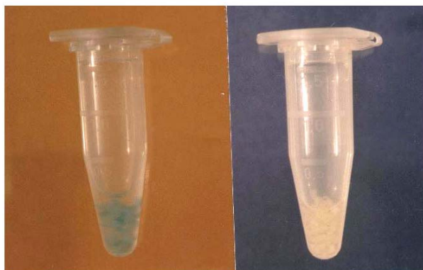
شکل ۴- بررسی آزمون GUS در گیاهان تراریخت شده در حضور سوبسترای X-Gluc ظهور رنگ آبی نشانگر بیان ژن GUS در گیاهان تراریخت (چپ) در مقایسه با گیاهان غیرتراریخت (راست) است