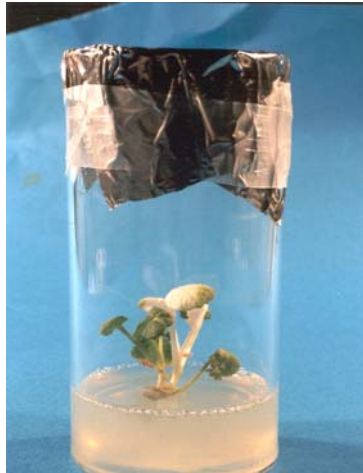
شکل ۲- انتخاب گیاهان تراریخت شده در محیط کشت حاوی عامل انتخابی کانامایسین. گیاه تراریخت نشده در محیط انتخاب، به رنگ سفید درآمده و گیاه تراریخت شده دارای ژن NPT II سبز باقی مانده است.

بیان ژن GUS منجر به تولید آنزیم \beta -گلوکونیداز می‌شود که به صورت طبیعی در گیاه وجود ندارد. این آنزیم قادر است ترکیب X-Gluc را بشکند و تولید رنگ آبی کند. به منظور بررسی بیان ژن GUS در گیاهان تراریخت شده، قطعات برگ و دمبرگی از گیاهان مقاوم به کانامایسین تهیه شد و در بافر حاوی X-Gluc در دمای ۳۷ درجه سانتی‌گراد قرار گرفت. ظهور رنگ آبی در آن‌ها نشان‌گر بیان ژن GUS در گیاهان تراریخت شده بود (شکل ۴). بیش از ۷۰٪ از گیاهان مقاوم به کانامایسین بیان ژن GUS را نشان دادند.