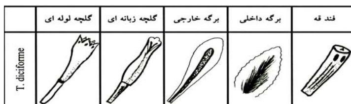
جدول ۴- تصاویر اجزای کپه در T. disciforme

از جنس Tripleurospermum تنها یک گونه T. disciforme (C.A. MEY.) SCHULTZ BIP. در خراسان موجود میباشد که شکل اجزای کپه آن در جدول ۴ ارائه گردیده است.