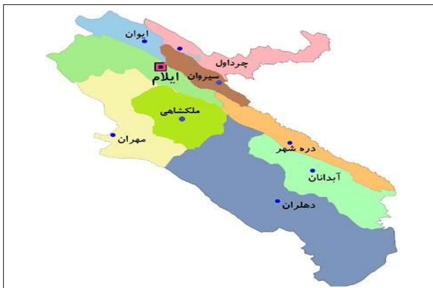
شکل ۲: موقعیت جغرافیای شهرستان دهلران در استان ایلام

شهرستان دهلران در جنوب ایلام و در فاصله ۹۱۰ کیلومتری تهران واقع شده است. دهلران آب و هوای بیابانی و نیمه بیابانی «گرم و خشک» دارد. این شهرستان در جنوب شرقی استان ایلام و جنوب غربی دینار کوه و در فاصله ۲۲۸ کیلومتری ایلام و ۱۰۰ کیلومتری شهرستان اندیمشک واقع شده است. این شهر که در دامنه جنوب و جنوب غربی دینار کوه قرار دارد. شکل ۲ موقعیت جغرافیای شهرستان دهلران در استان ایلام را نشان می دهد.