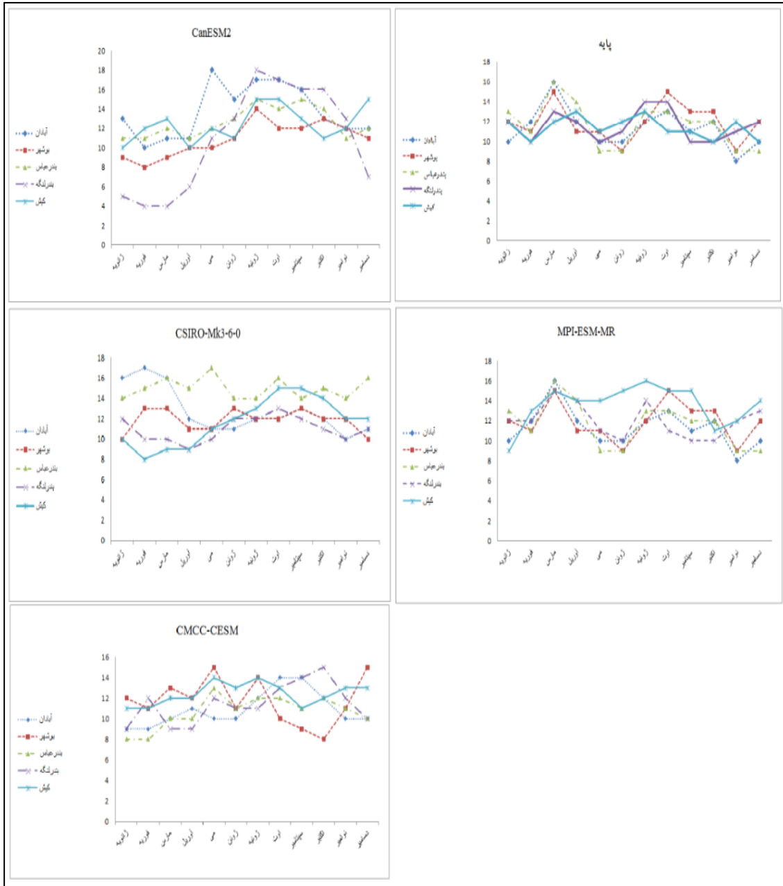
شکل ۳: امواج گرمایی استخراج شده ماهانه در داده پایه و آینده

تغییرات سالانه امواج گرمایی در دوره‌ی آینده نسبت به دوره‌ی پایه (جدول ۵) به این صورت است که فراوانی امواج گرمایی در دوره آینده برای ایستگاه‌های آبادان و بندرعباس در مدل‌های CanESM2 و CSIRO-Mk3-6-0، ایستگاه بوشهر در مدل‌های MPI-ESM-MR و CSIRO-Mk3-6-0 و ایستگاه بندرلنگه و MPI-ESM-MR و CMCC-CESM نسبت به دوره پایه افزایش نشان می‌دهد اما ایستگاه کیش در تمام مدل‌های مورد بررسی با افزایش فراوانی امواج گرمایی در سال‌های آینده روبه‌رو است.