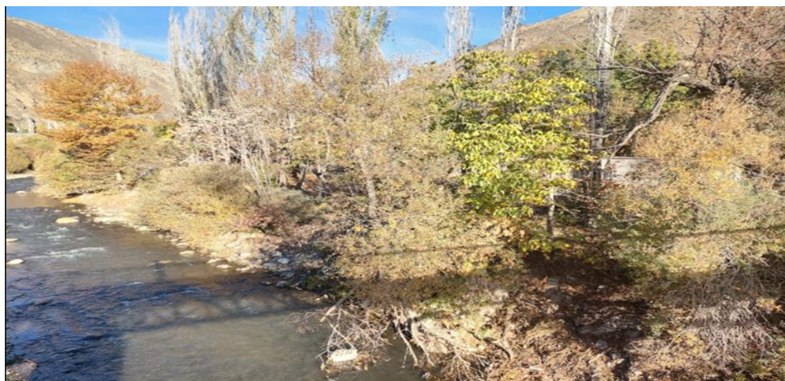
شکل ۳. محافظت سطحی کرانه توسط پوشش گیاهی و ریشه درختان