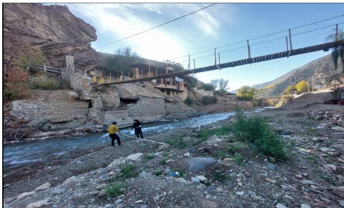
شکل ۶. تصویری از بازه فرسایش پذیری در کناره چپ و رسوبگذار در کناره راست رودخانه جاجرود از رودک تا کلیگون (بازه ۳)