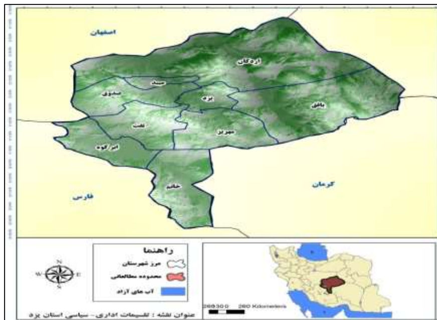
شکل ۱: محدوده مطالعه، استان یزد.