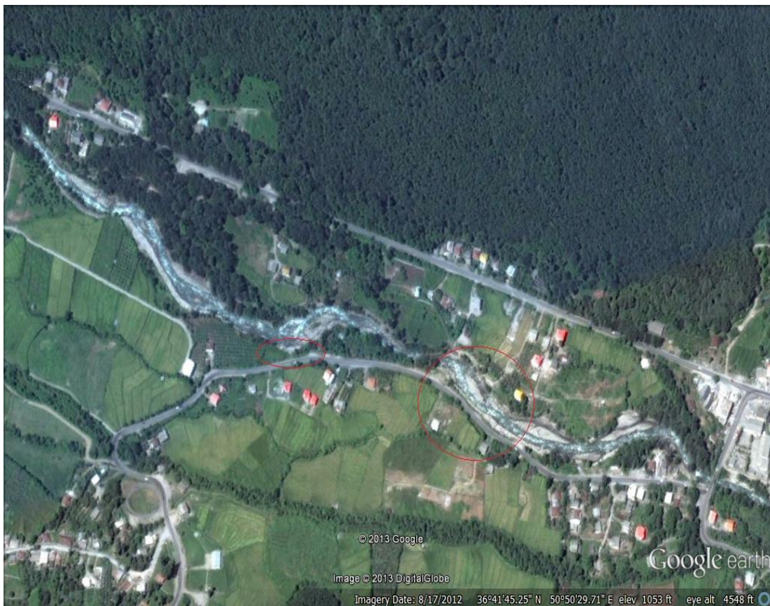
شکل ۳- وضعیت راه‌های ارتباطی که در معرض خطر مستقیم سیلاب قرار دارد (روستای گاوپل)