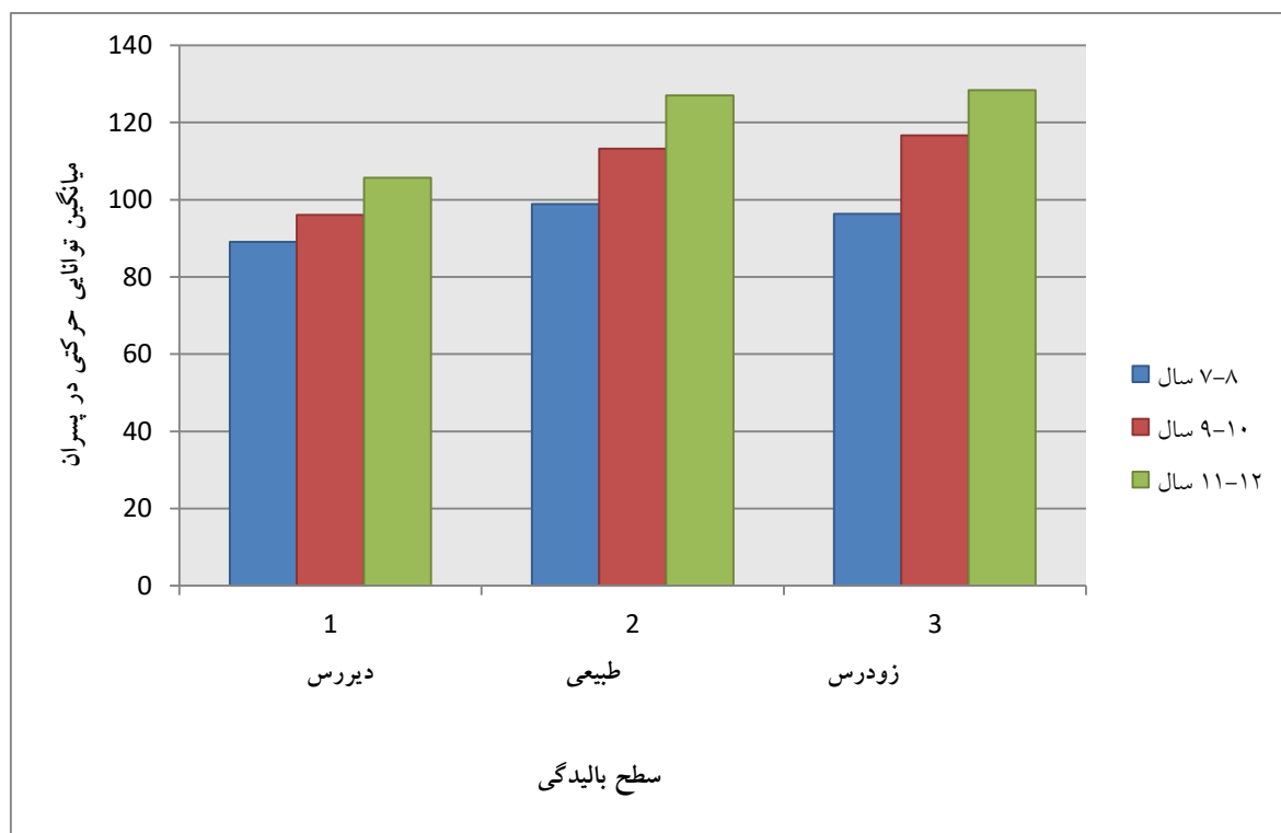
نمودار ۲. اثر تعاملی سطح بالیدگی و سن تقویمی دانش آموزان پسر

توانایی های حرکتی معنادار نیست. نمودار تعاملی ۲ نشان داد دانش آموزان پسر برای هر یک از رده های سنی ۷ تا ۸ سال، ۹ تا ۱۰ سال و ۱۱ تا ۱۲ سال در سطح بالیدگی طبیعی بالاترین نمره توانایی حرکتی و دانش آموزان پسر در رده های سنی ۷ تا ۸ سال، ۹ تا ۱۰ سال و ۱۱ تا ۱۲ سال در سطح بالیدگی دیررس دارای پایین ترین نمره توانایی حرکتی می باشند (نمودار ۲).