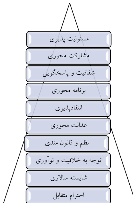
شکل ۱: ارزش‌های کلیدی حاکم بر دانشکده

از دیگر یافته‌های پژوهش حاضر که کمتر در مطالعات راهبردی به آن پرداخته می‌شود تعیین محورهای رشد و توسعه است. در این مطالعه ۴ محور با رویکرد دانشگاه‌های نسل چهارم تعیین شد که در ادامه کلیه تحلیل‌ها بر پایه این ۴ محور قرار گرفته است (شکل ۴).