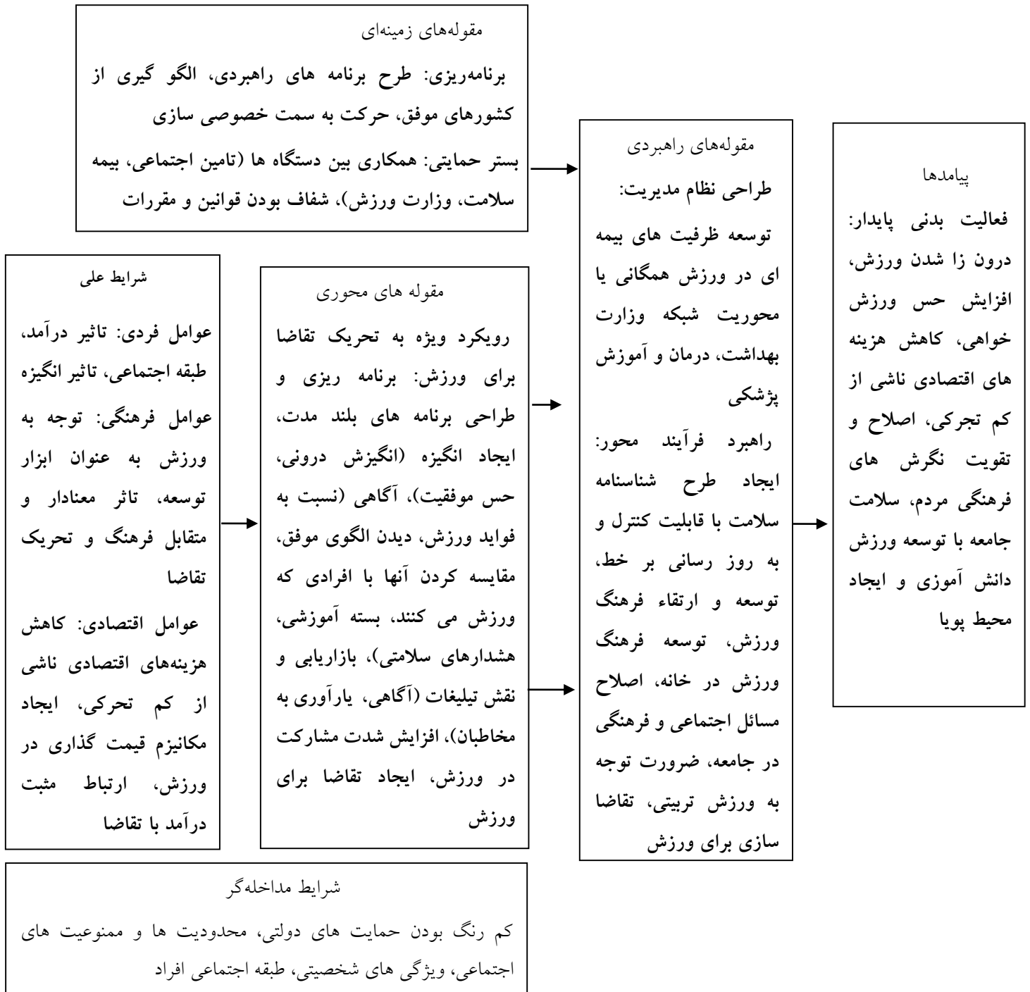
شکل ۱. الگوی تحریک تقاضا برای ورزش در جامعه ایرانی