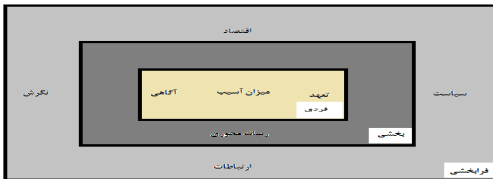
شکل ۱- بسترهای مسئولیت اجتماعی ورزشکاران

در این پژوهش در مرحله کدگذاری انتخابی به روش اشتراوس و کوربین، با توجه به نقش مفاهیم به دست آمده در تبیین فرایند طراحی الگوی مسئولیت پذیری اجتماعی ورزشکاران در قالب راهبردها، شرایط زمینه‌ای (داخلی)، شرایط مداخله گر (خارجی) و پیامدها به هم مرتبط شدند که در نمودار ۱ نشان داده شده است.