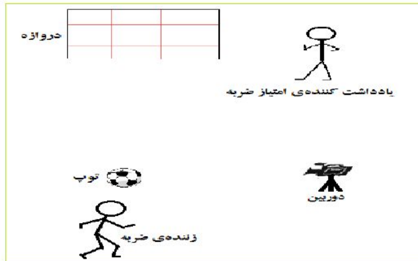
شکل ۲. نحوه دریافت اطلاعات

برای نشانه‌گذاری، از هفت نشانه استفاده شد که شش نشانه روی بازیکن و یک نشانه نیز روی توپ قرار گرفت. در جلسه‌های آزمون، پس از گرم کردن آزمودنی‌ها، نشانه‌ها روی نقاط آناتومیکی نصب شدند. این نقاط عبارت‌اند از: بالاترین نقطه تاج خاصره ۱ ، تروکانتر بزرگ ران ۲ ، اپی‌کندیل خارجی ران ۳ ، قوزک خارجی پا ۴ ، پاشنه ۵ و سر پنجمین استخوان کف پای ۶ (۲۰). شکل ۳-۳ موقعیت قرار گرفتن نشانه‌ها را نشان می‌دهد.