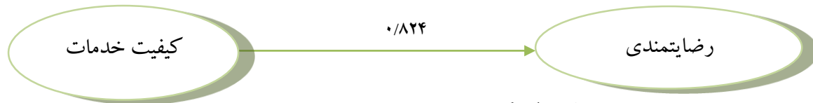
شکل ۱. تأثیر رگرسیونی متغیر کیفیت خدمات بر رضایتمندی

پروورش اندام در حد کم، ۴۶/۶ درصد در حد متوسط و ۴۲/۵ درصد در حد زیاد ارزیابی شده است. همچنین، نتایج نشان داد (شکل ۱ و جدول ۱) در مجموع، متغیر کیفیت خدمات پیش‌بین معناداری برای رضایتمندی مشتریان محسوب می‌شود ( p < 0.01 )، (\beta = 0.824) .