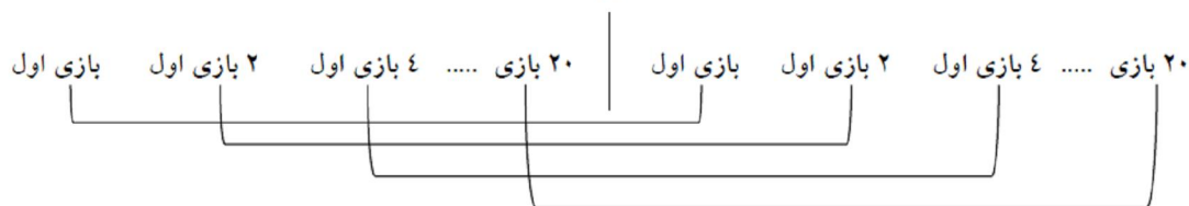
شکل ۱. نحوه مقایسه عملکرد تیم‌ها قبل و بعد از تغییر

از آزمون کلموگروف اسمیرنوف برای تعیین طبیعی بودن توزیع داده‌ها استفاده شد و پس از تعیین طبیعی بودن همه داده‌ها برای تجزیه و تحلیل از روش‌های آمار توصیفی و آمار استنباطی (تحلیل واریانس) استفاده شد. این محاسبات از طریق نرم‌افزار SPSS (نسخه ۱۸) اجرا شد.