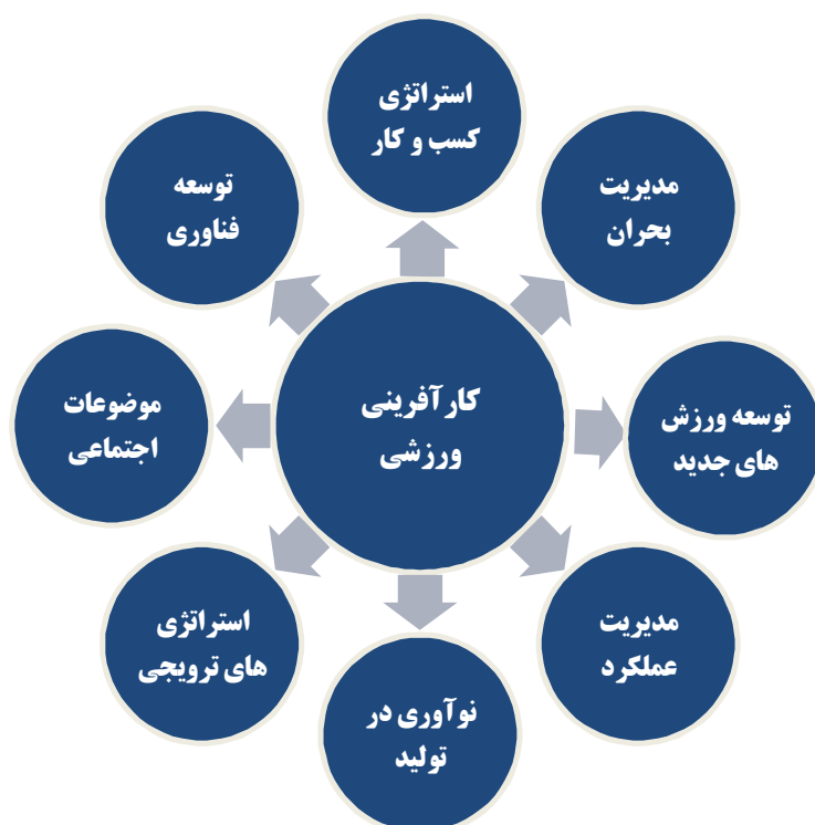
شکل ۱. وجوه کارآفرینی ورزشی

انواع متعددی از کارآفرینی که در ورزش حادث می شوند عبارتند از: کارآفرینی جامعه محور، کارآفرینی شرکتی، کارآفرینی بومی، کارآفرینی سازمانی، کارآفرینی بین المللی، کارآفرینی اجتماعی، کارآفرینی فناوری، کارآفرینی زنان و کارآفرینی شهری (رک شکل ۲).