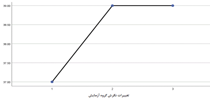
شکل شماره ۱. تغییرات نگرش گروه آزمایش پژوهش در سه مرحله پیش آزمون، پس آزمون و آزمون پیگیری

نتایج تحلیل واریانس با اندازه‌گیری‌های مکرر ارائه شده در جدول شماره ۶ حاکی از وجود تفاوتی معنی‌دار میان میانگین نمرات متغیرهای نگرش، دانش و رفتار مربیان حاضر در گروه آزمایش پژوهش در پیش آزمون، پس آزمون و آزمون پیگیری بوده است که نشان‌دهنده ماندگاری اثر آموزش مفاهیم حقوق ورزشی بر ارتقاء متغیرهای مذکور پس از گذشت ۱۲ هفته از اتمام مداخله آموزشی بوده است. این نتایج به صورتی دیگر در شکل‌های ۱ تا ۳ ارائه گردیده است.