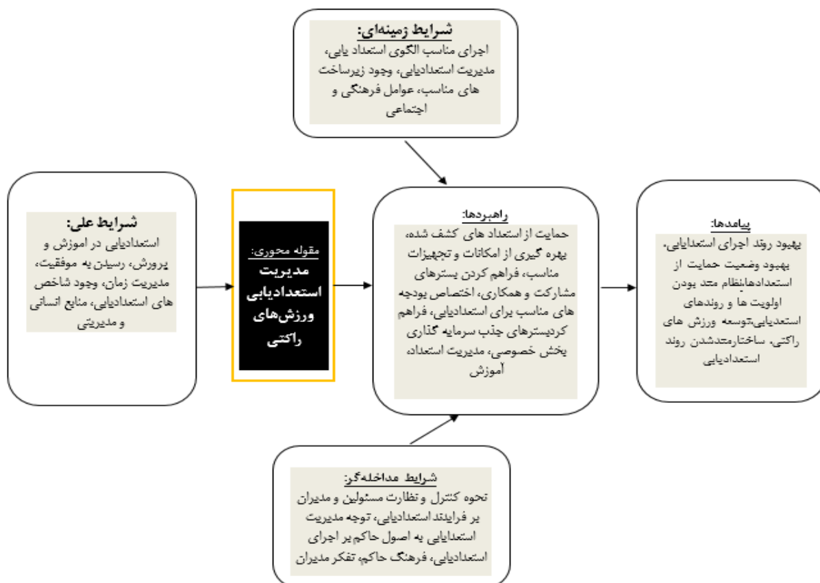
شکل ۱. مدل پارادایمی مدیریت استعدادیابی به روش استراس و کوربین در ورزش‌های راکتی

این مرحله از پژوهش کدگذاری گزینشی و مدل نهایی ارائه می‌گردد. در مرحله کدگذاری گزینشی یا انتخابی شکل‌گیری و پیوند هر دسته‌بندی با سایر گروه‌ها تشریح می‌شود. در این قسمت کدگذاری‌های محوری به صورت ترکیبی و محتوای هر یک از آنها در قالب کدهای نظری قرار داده شدند که در جدول زیر ارائه گردید: