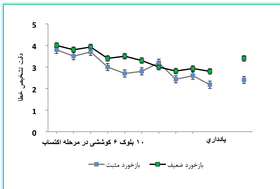
شکل-۳: نمایش میانگین دقت برآورد خطا دو گروه در مرحله تمرین و یادداری