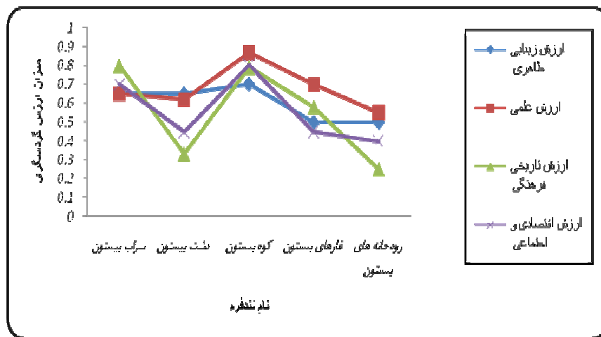
شکل (۲) مقایسه ارزش گردشگری لندفرم‌های ژئومورفولوژیکی منطقه مورد مطالعه

۰/۵۱ و مجموعه رودخانه‌های بیستون (گاماسیاب و دینور آب) با ۰/۴۲ به ترتیب در رتبه‌های بعدی قرار دارند. اما از نظر ارزش بهره‌وری کوه بیستون، سراب بیستون و دشت بیستون دارای بالاترین ارزش بهره‌وری می‌باشند. استقرار مراکز جمعیتی، نزدیکی نسبی به مرکز استان، همجواری این لندفرم‌ها و جاذبه‌ها به همدیگر، وجود نسبی امکانات رفاهی و برگزاری مراسم فرهنگی در طول سال در دامنه کوه بیستون و کنار سراب بیستون از جمله دلایلی هستند که موجب برتری این لندفرم‌ها شده است و پس از آن غارهای مجموعه بیستون با ۰/۵ دارای بیشترین ارزش بهره‌وری و در نهایت رودخانه‌ها در رتبه بعدی قرار دارند. ارزیابی‌ها نشان می‌دهد که ارزش‌های گردشگری لندفرم‌های ژئومورفولوژیکی منطقه نمونه گردشگری عمدتاً به ترتیب به دلیل بالا بودن ارزش علمی، ارزش زیبایی ظاهری، ارزش تاریخی و فرهنگی و سپس ارزش اقتصادی و اجتماعی این لندفرم‌ها است که باید به رابطه بین این ارزش‌ها در حال حاضر توجه شود.