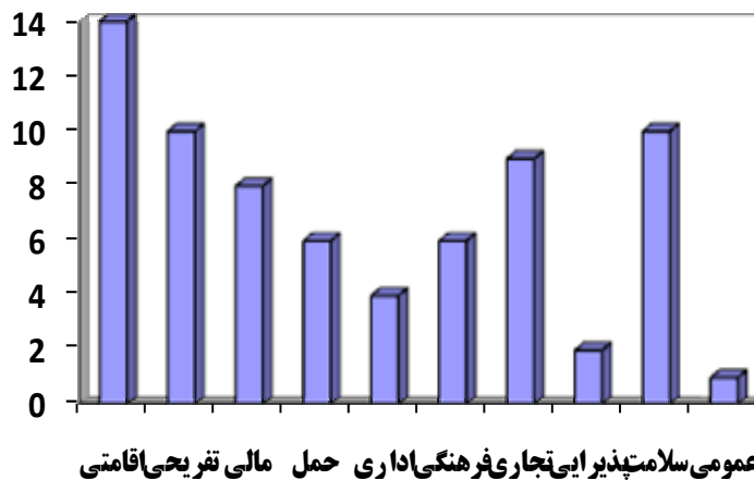
شکل (۲) نمودار اولویت فرصت های کار آفرینی زمین گردی در منطقه جلفا