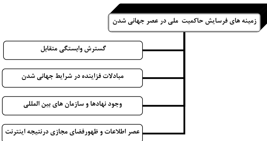
شکل (۳) زمینه های فرسایش حاکمیت ملی در عصر جهانی شدن (ترسیم از: نگارندگان)

قابل پیش بینی در جهت ایفای نقش خود به عنوان یک نهاد تأثیر گذار تداوم پیدا خواهد کرد. اما وجود یا فقدان حاکمیت به صورتی هر چه کمتر ویژگی تعیین کننده ساختار یا شیوه عمل دولت خواهد بود (کلارک، ۱۳۸۲: ۱۷۳). (شکل ۳)