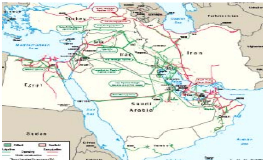
شکل (۲) نقشه خطوط لوله نفت و گاز در خلیج فارس

یکی از مناسب ترین و اقتصادی ترین روش های انتقال گاز طبیعی در حال حاضر، انتقال بوسیله خط لوله می باشد که هم اکنون قسمت اعظم انتقال گاز جهان از این طریق صورت می گیرد. بطوری که در پایان سال ۲۰۱۰ از مجموع ۹۷۵/۲۲ میلیارد متر مکعب گاز مبادله شده، ۶۷۹/۵۹ میلیارد متر مکعب آن از طریق خط لوله بوده است (Bp Statistical Review of World Energy, ۲۰۱۱: ۲۸). در منطقه خلیج فارس نیز هرچند که هم اکنون خطوط لوله گازی بین مرزی، به ندرت وجود دارد اما قراردادهای عمده ای بین کشورهای منطقه جهت انتقال گاز از طریق خط لوله بسته شده است که بعضی از آنها اجرایی شده اند. (شکل ۲)