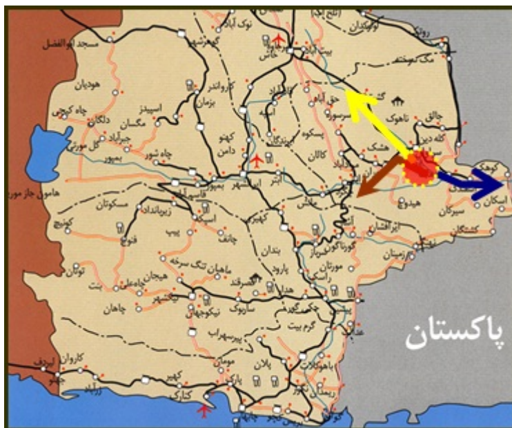
شکل (۲) نمایی از محورهای اصلی منطقه نمونه گردشگری کلپورگان با نواحی پیرامونی