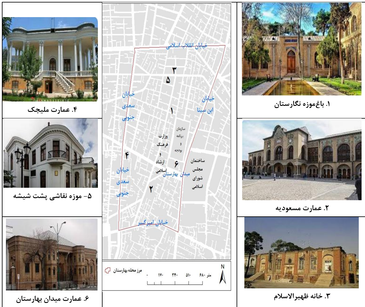
شکل (۲). موقعیت برخی از اماکن مهم و تاریخی محله بهارستان