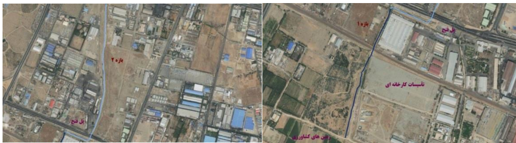
شکل (۵). تصویر هوایی مسیر بازه ۲