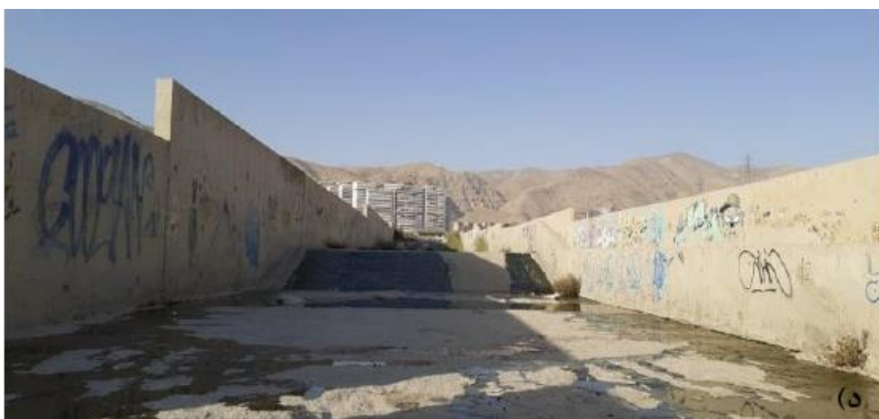
شکل (۳). نمونه‌هایی از تغییرات در بستر رودخانه: الف) محافظ کرانه به صورت دیواره بتنی. ب) پایه‌های پل دانش در مسیر رودخانه. ج) پایه‌های پل بزرگراه شهید خرازی در مسیر رودخانه. د) کانال کشی بتنی در کف و کناره رودخانه.

شرایط بازه‌ها بر اساس شاخص کیفی مورفولوژیک رود به صورت زیر تشریح می‌شود: