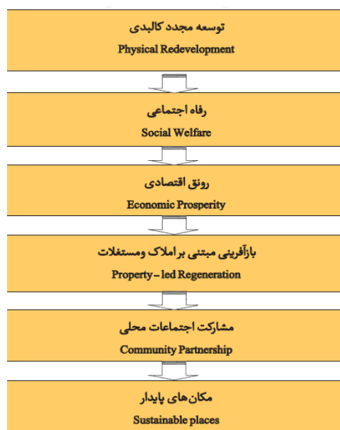
شکل (۱). تعامل بازآفرینی و توسعه پایدار

توسعه پایدار دارد. نقطه برخورد و تلاقی این دو مفهوم با یکدیگر بر منطقی دیدن توسعه و نیل به برآیند مثبت اثرات مختلف عوامل اجتماعی- فرهنگی، محیطی و اقتصادی هست (پوراحمد و همکاران، ۱۳۹۶، ۱۷۶). بدین ترتیب به تدریج نظریه شهرهای پایدار با دیدگاه بازآفرینی مرتبط گردیده است. در این راستا تعاریفی از بازآفرینی شکل گرفت که به مؤلفه‌های پایداری نزدیک شده است. اساس بازآفرینی شهری پایدار، تعاملات اجتماعات محله‌ای و دستیابی به توافق عمومی است. بدین معنی که در بازآفرینی شهری گونه‌های جدید نهادی شکل می‌گیرند که سعی دارند سیاست‌های بازآفرینی اجتماع مدار را به صورت جامع و یکپارچه و از پایین به بالا تبیین کنند به صورتی که همه افراد ذی‌نفع را در بر بگیرد (فرجی ملائی، ۱۳۸۹، ۱۵). با وجود ظهور مفاهیم نو در بازآفرینی و توسعه پایدار، هماهنگی کمی بین این دو؛ خصوصاً بازآفرینی اقتصادی در مقایسه با پایداری برای نیل به اهداف بازآفرینی شهری وجود داشته است. تعامل مابین دو مفهوم بازآفرینی و توسعه پایدار در شکل (۱) به تصویر کشیده شده است.