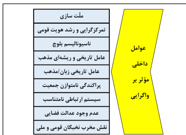
شکل (۵). عوامل و محرک‌های داخلی مؤثر بر واگرایی

عوامل خارجی مؤثر بر واگرایی عبارت‌اند از: حسینی (۱۳۹۴) فضای بین‌المللی و نیز همسایگی و امتداد قومی بلوچ‌های جنوب شرق ایران با بلوچ‌های افغانستان و پاکستان، موقعیت مرزی و حاشیه‌ای بلوچ‌های سیستان و بلوچستان را به‌عنوان برخی عوامل خارجی مؤثر بر واگرایی در این استان ذکر کردند. جوکار و همکاران (۱۴۰۰) در مطالعه خود نیز چرخش در سیاست‌های قومی کشورهای همسایه دارای قوم بلوچ به‌خصوص در پاکستان، بی‌ثباتی پاکستان و تأثیر آن بر واگرایی، مداخلات کشورهای خارجی چه در عرصه پیرامونی و چه در عرصه جهانی، بروز تنش‌های قومی در عرصه پیرامونی جنوب شرق ایران عوامل خارجی مؤثر بر واگرایی نام بردند (جوکار و همکاران، ۱۴۰۰: ۱۴۰). برخی از مهم‌ترین عوامل خارجی مؤثر بر واگرایی در جنوب شرق کشور و با تأکید بر قوم بلوچ در شکل (۶) آورده شده است.