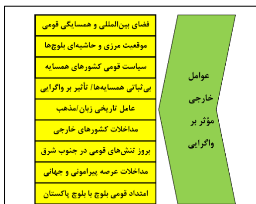
شکل (۶). عوامل و محرک‌های خارجی مؤثر بر واگرایی

عوامل خارجی مؤثر بر واگرایی عبارت‌اند از: حسینی (۱۳۹۴) فضای بین‌المللی و نیز همسایگی و امتداد قومی بلوچ‌های جنوب شرق ایران با بلوچ‌های افغانستان و پاکستان، موقعیت مرزی و حاشیه‌ای بلوچ‌های سیستان و بلوچستان را به‌عنوان برخی عوامل خارجی مؤثر بر واگرایی در این استان ذکر کردند. جوکار و همکاران (۱۴۰۰) در مطالعه خود نیز چرخش در سیاست‌های قومی کشورهای همسایه دارای قوم بلوچ به‌خصوص در پاکستان، بی‌ثباتی پاکستان و تأثیر آن بر واگرایی، مداخلات کشورهای خارجی چه در عرصه پیرامونی و چه در عرصه جهانی، بروز تنش‌های قومی در عرصه پیرامونی جنوب شرق ایران عوامل خارجی مؤثر بر واگرایی نام بردند (جوکار و همکاران، ۱۴۰۰: ۱۴۰). برخی از مهم‌ترین عوامل خارجی مؤثر بر واگرایی در جنوب شرق کشور و با تأکید بر قوم بلوچ در شکل (۶) آورده شده است.