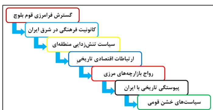
شکل (۴). عوامل و محرک‌های خارجی مؤثر بر همگرایی و انسجام ملی

عوامل خارجی مؤثر بر همگرایی عبارت‌اند از: علاوه بر عوامل و محرک‌های داخلی مؤثر بر همگرایی و انسجام ملی برخی عوامل و محرک‌ها نیز خارجی هستند که این عوامل از نظر رحمانی‌ساعد و ابراهیمی (۱۳۹۸) عبارت‌اند از: گسترش فرامرزی قومیت‌ها و از جمله قوم بلوچ در جنوب شرق کشور و کانونیت فرهنگی قوم بلوچ در جنوب شرق ایران، سیاست تنش‌زدایی منطقه‌ای، ارتباطات اقتصادی تاریخی تجاری با کشورهای هم‌جوار و رواج بازارچه‌های مرزی امروزی با کشورهای افغانستان و پاکستان از این جمله هستند (رحمانی‌ساعد و ابراهیمی، ۱۳۹۸: ۱۶۸). همچنین سیاست‌های خشن قومی در کشورهای هم‌جوار نسبت به قوم بلوچ و سیستانی‌ها مهم‌ترین عوامل و محرک‌های خارجی مؤثر بر همگرایی و انسجام ملی قوم بلوچ در استان سیستان و بلوچستان و در جنوب شرق کشور می‌باشند (جوکار و همکاران، ۱۴۰۰: ۱۴۰). در شکل (۴) برخی از عوامل و محرک‌های خارجی مؤثر بر همگرایی و انسجام ملی قوم بلوچ در استان سیستان و بلوچستان و در جنوب شرق کشور آورده شده‌اند.