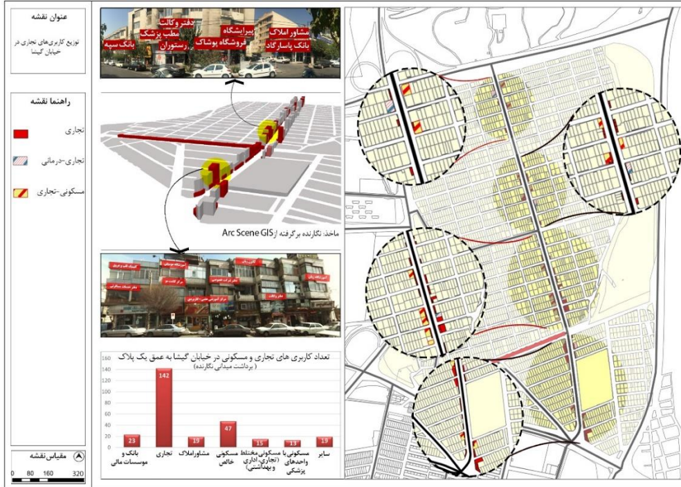
شکل (۳). نقشه توزیع و پراکندگی کاربری‌های تجاری در خیابان گیشا

به اندازه‌ای باشد که حضور ۲۳ بانک را توجیه کند. به منظور مشخص تر شدن وضعیت حضور بانک‌ها و مشاورین املاک در این خیابان، شکل (۵) در تشریح عامل دسترسی به مراکز مهم فعالیت اقتصادی ترسیم شده است.