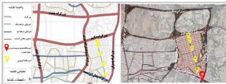
شکل (۴). نقشه مسیر دسترسی عمومی محدوده کوی نصر

شاخص دسترسی به مراکز حمل و نقل عمومی با بار عاملی ۰.۷۵۱ در عامل اقتصاد زمین و توزیع فعالیتی اثرگذار است. نقشه زیر مسیر دسترسی‌های مترو و اتوبوس محدوده کوی نصر را نشان می‌دهد. وجود ایستگاه‌های مترو و ایستگاه اتوبوس در کوی نصر و اطراف آن نشان از وضعیت مطلوب دسترسی در محدوده دارد. این شاخص با شاخص‌های قیمت مسکونی و تجاری در ارتباط است. به گونه‌ای که بهبود دسترسی و حمل و نقل عمومی در این محدوده می‌تواند سبب افزایش سفرها، افزایش حضور پذیری مردم و در نهایت عاملی تأثیرگذار در قیمت تجاری و مسکونی در این محله و توجیه‌پذیری افزایش فعالیت‌های اقتصادی و تغییر کاربری‌ها باشد.