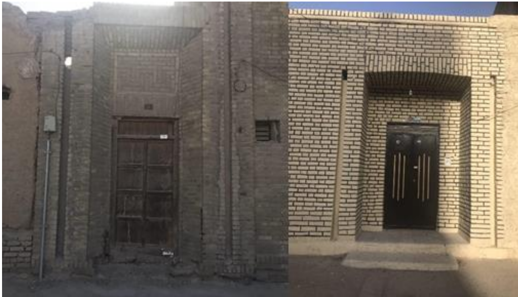
شکل (۲). سردر و تزیینات بنای مسکونی دوره پهلوی در شهر زاهدان (محقق، ۱۴۰۰)