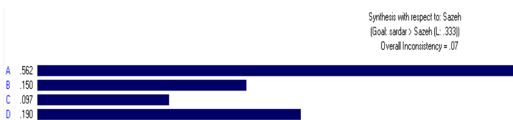
شکل (۳). اولویت‌بندی ویژگی‌های کالبدی سردر بناها (زیرمعیارها) دوره پهلوی در شهر زاهدان

اولویت‌بندی ویژگی‌های تزئینی سردر بناهای دوره پهلوی در شهر زاهدان (زیرمعیارها) اولویت‌بندی ویژگی‌های تزئینی سردر بناهای دوره پهلوی در شهر زاهدان نیز بررسی شد. در این زمینه نیز چهار ویژگی مورد تأکید بوده است که شامل کتیبه آجری ساده، تزئینات (ساده، جناغی، پیچ ماری و رگ چین)، تاجدار ساده با طاق گرد و جناغی و آجرکاری ساده با چین افقی است. تحلیل دیدگاه کارشناسان نشان می‌دهد که ویژگی استفاده از تزئینات ساده، جناغی، پیچ ماری و رگ چین با وزن ۰/۳۷۶ به‌عنوان مهم‌ترین ویژگی یا شاخص تزئینی سردر بناها شناخته شده است. در حقیقت این ویژگی، سردر بناهای دوره پهلوی در شهر زاهدان را متمایز می‌نماید. همچنین استفاده از کتیبه‌های آجری ساده نیز با وزن ۰/۲۴۱ در رتبه دوم اهمیت قرار گرفته است که در بیشتر بناها و سردر بناها قابل مشاهده است و نقش مهمی را در تزئینات سردرها ایفا می‌کند. تاجدار بودن ساده با طاق گرد و جناغی با وزن ۰/۲۳۱ در رتبه سوم و آجرکاری ساده با چین افقی نیز با وزن ۰/۱۵۲ در رتبه چهارم این اولویت‌بندی و اهمیت قرار گرفته‌اند؛ بنابراین استفاده از آجر، تاجدار بودن، استفاده از طاق‌های گر و جناغی و همچنین تزئینات غالب با آجر و به‌صورت ساده، غالب ویژگی‌های تزئینی سردر بناهای دوره پهلوی در شهر زاهدان محسوب می‌شود. جدول (۶) و شکل (۴) اولویت‌بندی ویژگی‌های تزئینی سردر بناها (زیرمعیار) دوره پهلوی در شهر زاهدان را با روش AHP نشان می‌دهد.