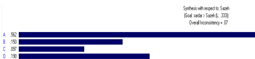
شکل (۳). اولویت‌بندی ویژگی‌های کالبدی سردر بناها (زیرمعیارها) دوره پهلوی در شهر زاهدان

اولویت‌بندی ویژگی‌های تزئینی سردر بناهای دوره پهلوی در شهر زاهدان (زیرمعیارها) اولویت‌بندی ویژگی‌های تزئینی سردر بناهای دوره پهلوی در شهر زاهدان نیز بررسی شد. در این زمینه نیز چهار ویژگی مورد تأکید بوده است که شامل کتیبه آجری ساده، تزئینات (ساده، جناغی، پیچ ماری و رگ چین)، تاجدار ساده با طاق گرد و جناغی و آجرکاری ساده با چین افقی است. تحلیل دیدگاه کارشناسان نشان می‌دهد که ویژگی استفاده از تزئینات ساده، جناغی، پیچ ماری و رگ چین با وزن ۰/۳۷۶ به‌عنوان مهم‌ترین ویژگی یا شاخص تزئینی سردر بناها شناخته شده است. در حقیقت این ویژگی، سردر بناهای دوره پهلوی در شهر زاهدان را متمایز می‌نماید. همچنین استفاده از کتیبه‌های آجری ساده نیز با وزن ۰/۲۴۱ در رتبه دوم اهمیت قرار گرفته است که در بیشتر بناها و سردر بناها قابل‌مشاهده است و نقش مهمی را در تزئینات سردرها ایفا می‌کند. تاجدار بودن ساده با طاق گرد و جناغی با وزن ۰/۲۳۱ در رتبه سوم و آجرکاری ساده با چین افقی نیز با وزن ۰/۱۵۲ در رتبه چهارم این اولویت‌بندی و اهمیت قرار گرفته‌اند؛ بنابراین استفاده از آجر، تاجدار بودن، استفاده از طاق‌های گر و جناغی و همچنین تزئینات غالب با آجر و به‌صورت ساده، غالب ویژگی‌های تزئینی سردر بناهای دوره پهلوی در شهر زاهدان محسوب می‌شود. جدول (۶) و شکل (۴) اولویت‌بندی ویژگی‌های تزئینی سردر بناها (زیرمعیار) دوره پهلوی در شهر زاهدان را با روش AHP نشان می‌دهد.