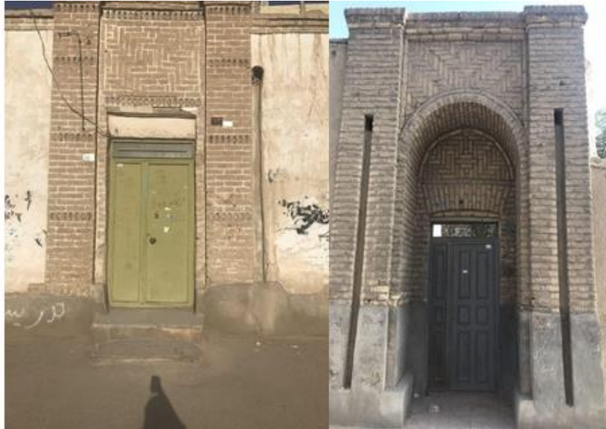
شکل (۱). سردر و تزیینات بنای مسکونی دوره پهلوی در شهر زاهدان (محقق، ۱۴۰۰)