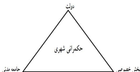
شکل (۱). مثلث حکمرانی شهری، (نوبری و رحیمی، ۱۳۹۰)

حکمرانی شهری: برایان مک لالین اولین نظریه پردازی است که مفهوم حکمروایی خوب را مطرح کرد (کاظمیان، ۱۳۸۷: ۵). از نظر وی «حکومت شهری» باید نسبت به روندهای تغییر در شهر پاسخگوتر باشد، اقداماتش با مسائل شهری و تحول آنها متناسبتر باشد، نسبت به اجتماع مسئول و پاسخگوتر و به عنوان بخش مهمی از نظام یادگیری اجتماعی بهتر عمل کند و سرانجام نقش مهمی در پیش بینی، کشف و استقبال از آینده ایفا کند (عزیزی و همکاران، ۱۳۹۷: ۶). این فرایندها به وجود شبکه ارتباطات در داخل سازمانهای رسمی حکومت و نظام های برنامه ریزی آن و همچنین شبکه ارتباطات میان آن سازمانها و اجتماع و نظام های شهری آن بسیار متکی است (برک پور، ۱۳۸۸: ۱۷۹). حکمرانی شهری، طبق تعریف زیست بوم سازمان ملل عبارت است از مجموع روش های برنامه ریزی و مدیریت عمومی شهر از سوی افراد، نهادهای عمومی و نهادهای خصوصی و نیز فرایند مستمری است که از آن طریق، منافع متضاد یا متعارض با یکدیگر همراه شده و زمینه همکاری و کنش متقابل فراهم می آید. طبق این تعریف حکمرانی شهری، هم نهادهای رسمی و هم اقدامات غیر رسمی و سرمایه اجتماعی شهروندان را در بر می گیرد (UN- HABITAT, ۲۰۱۶). فرآیند سیاسی حکمروایی شهری به صورت شکل (۱) در نظر گرفته می شود.