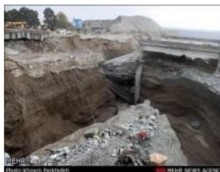
شکل (۱). تخریب پل در جاده قدیم کرج در اواخر آبان ماه سال ۱۳۹۱