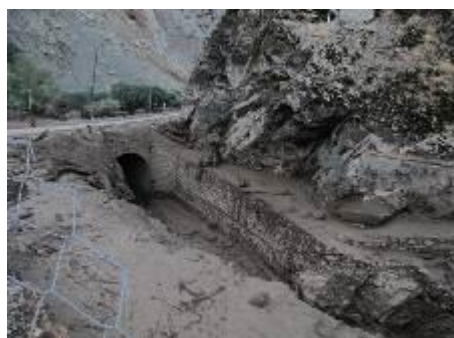
شکل (۲). خسارات سیلاب یکشنبه ۲۸ تیرماه در جاده سنگان (مشرق نیوز، ۱۳۹۴)

فراوانی را در مسیر خود ایجاد کند (معاونت برنامه‌ریزی و نظارت راهبردی ریاست‌جمهوری، ۱۳۹۳: ۴۶). با توجه به وجود روددره‌ها و مسیل‌ها و احداث اتوبان‌های بزرگ و عمده شرقی- غربی از روی این روددره‌ها و مسیل‌ها، ضرورت احداث پل‌ها اجتناب‌ناپذیر بوده است، ولی در این پروژه‌ها به ویژگی‌های ژئومورفولوژیک، مورفولوژیک و ناپایداری نیمرخ‌های طولی و عرضی رودخانه‌ها کمتر توجه شده است و بنابراین پایداری برخی از این سازه‌ها در معرض خطر است و ساخت غیراصولی این سازه‌ها می‌توانند منجر به افزایش آب‌گرفتگی معابر و خیابان‌ها و تسهیل خطر سیلاب در کلان‌شهر تهران و سایر شهرها شود. در صورت بروز این مخاطره، مشکلات و خساراتی برای شهروندان به بار آورده خواهد شد و بنابراین این مسئله نیازمند توجه جدی است. به‌طور مثال پل کن در جاده قدیم کرج در اثر بارش‌های اواخر آبان ماه سال ۱۳۹۱ ریزش کرد شکل (۱). دخل و تصرف در حریم کانال تجریش، کاهش عرض این کانال و ایجاد پل بر روی آن، باعث شد که در رخداد سیل سال ۱۳۶۶ خسارت‌های زیادی به شهروندان وارد شود. همچنین به‌دلیل تغییرات مورفولوژی و فرسایش در رودخانه کن، در محدوده پل سه‌راهی دهکده المپیک تا حدودی منجر به جابه‌جایی و تنگ‌شدگی، انسداد مسیر جریان و انتقال آن به کرانه چپ و ایجاد فرسایش در آن کرانه و تغییر مسیر رودخانه به‌صورت موضعی شده است (روزخس، ۱۳۸۴). این موارد را می‌توان به‌عنوان شاهدهی از عدم انطباق و توجه کمتر به عملیات پل‌سازی در ارتباط با ویژگی‌های مورفولوژیک و مورفومتریکی مسیل‌ها و روددره‌های تهران و سایر مناطق کشور در نظر گرفت و ضرورت پژوهش در این زمینه را خاطر نشان می‌کند شکل (۲).