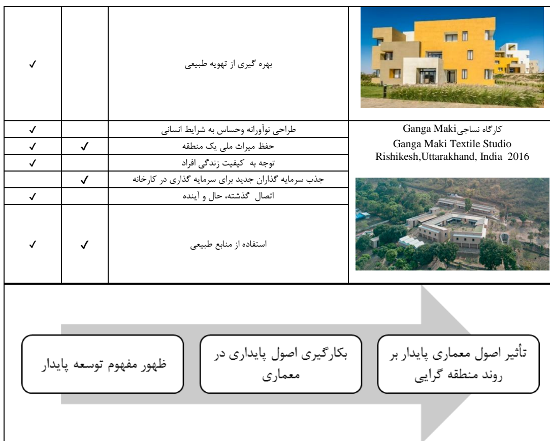
شکل (۳). فرایند تحول منطقه گرایبی پایدار

الکساندر زونیس و لیان لفور در آخرین چشم انداز خود در باب منطقه گرایبی، نمونه هایی از پروژه های اجرایی متفاوت در کشورهای مختلف دنیا را ذکر کرده و خاطر نشان می سازند که طی سال های واپسین قرن بیستم تا به امروز، تئوری معماری منطقه ای از منظرهای مختلف گرایش های زیادی گرفته و بسط یافته و با عملکرد خود نیز متناسب تر شده است. از تحلیل این آثار می توان به این نتیجه دست یافت که برخی از آثار منطقه گرایبی امروز از رویکرد پایداری تأثیر پذیرفته و دارای ویژگی های پایداری هستند. همچنین با بررسی سایر آثار که در مجلات و جوایز معماری که در سال های اخیر از آن ها با عنوان معماری منطقه گرا یاد شده می توان تاییدی بر نظریه زونیس و لفور در مورد ویژگی های منطقه گرایبی امروز باشد.