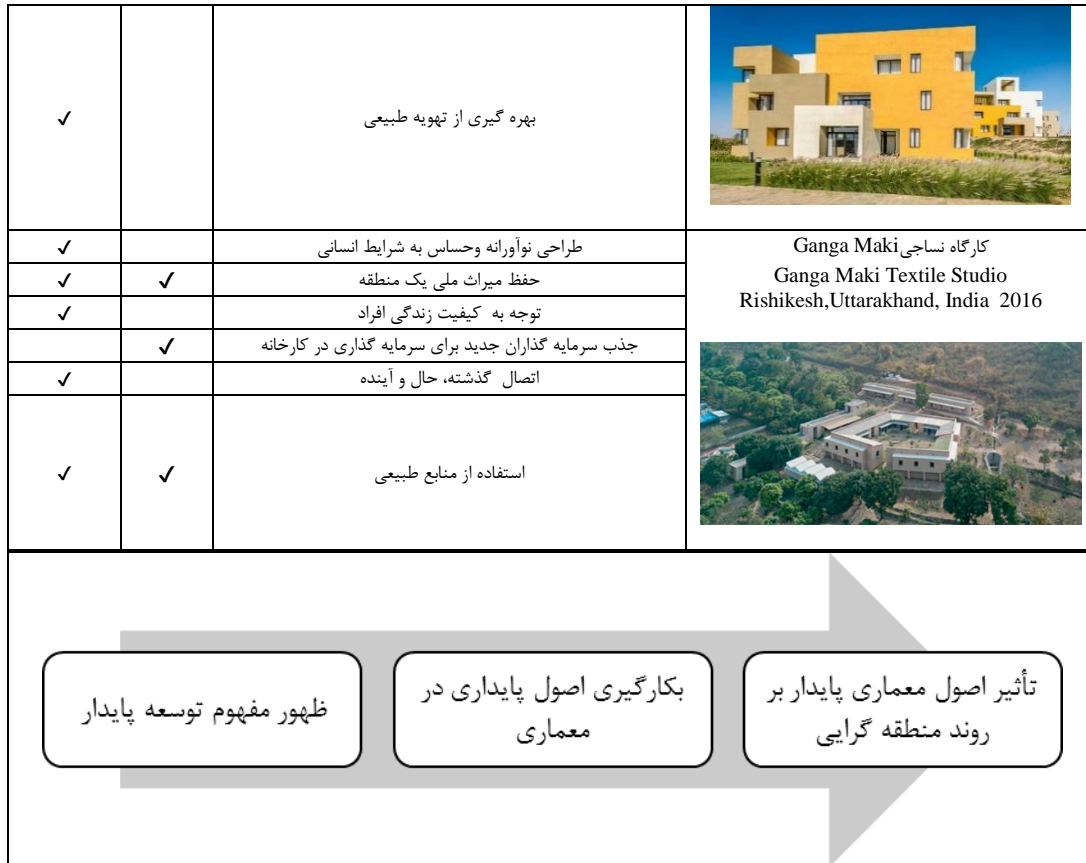
شکل (۳). فرایند تحول منطقه گرایبی پایدار

الکساندر زونیس و لیان لفور در آخرین چشم انداز خود در باب منطقه گرایبی، نمونه هایی از پروژه های اجرایی متفاوت در کشورهای مختلف دنیا را ذکر کرده و خاطر نشان می سازند که طی سال های واپسین قرن بیستم تا به امروز، تئوری معماری منطقه ای از منظرهای مختلف گرایش های زیادی گرفته و بسط یافته و با عملکرد خود نیز متناسب تر شده است. از تحلیل این آثار می توان به این نتیجه دست یافت که برخی از آثار منطقه گرایبی امروز از رویکرد پایداری تأثیر پذیرفته و دارای ویژگی های پایداری هستند. همچنین با بررسی سایر آثار که در مجلات و جوایز معماری که در سالهای اخیر از آنها با عنوان معماری منطقه گرا یاد شده می توان تاییدی بر نظریه زونیس و لفور در مورد ویژگی های منطقه گرایبی امروز باشد.